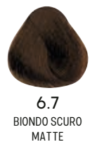
6.7 BIONDO SCURO MATTE