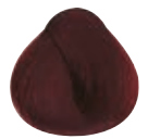
5.6 CASTANO CHIARO ROSSO