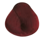
6.6 BIONDO SCURO ROSSO