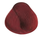
7.6 BIONDO MEDIO ROSSO