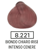
8.221 BIONDO CHIARO IRISÉ INTENSO CENERE