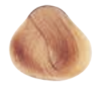
9.04 BIONDO CHIARISSIMO LEGGERMENTE RAME