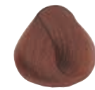
5.62 CASTANO CHIARO ROSSO IRISÉ