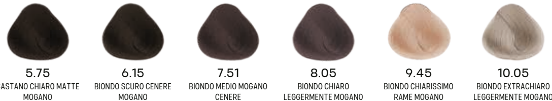
5.75 CASTANO CHIARO MATTE MOGANO 6.15 BIONDO SCURO CENERE MOGANO 7.51 BIONDO MEDIO MOGANO CENERE 8.05 BIONDO CHIARO LEGGERMENTE MOGANO 9.45 BIONDO CHIARISSIMO RAME MOGANO 10.05 BIONDO EXTRACHIARO LEGGERMENTE MOGANO