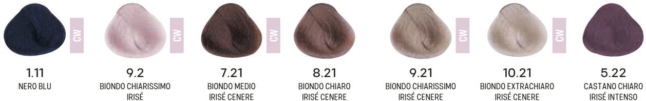
1.11 NERO BLU 9.2 BIONDO CHIARISSIMO IRISÉ 7.21 BIONDO MEDIO IRISÉ CENERE 8.21 BIONDO CHIARO IRISÉ 9.21 BIONDO CHIARISSIMO IRISÉ 10.21 BIONDO EXTRACHIARO IRISÉ CENERE 5.22 CASTANO CHIARO IRISÉ INTENSO