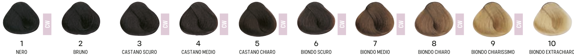
1 NERO 2 BRUNO 3 CASTANO SCURO 4 CASTANO MEDIO 5 CASTANO CHIARO 6 BIONDO SCURO 7 BIONDO MEDIO 8 BIONDO CHIARO 9 BIONDO CHIARISSIMO 10 BIONDO EXTRACHIARO