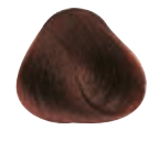
6.45 BIONDO SCURO RAME MOGANO