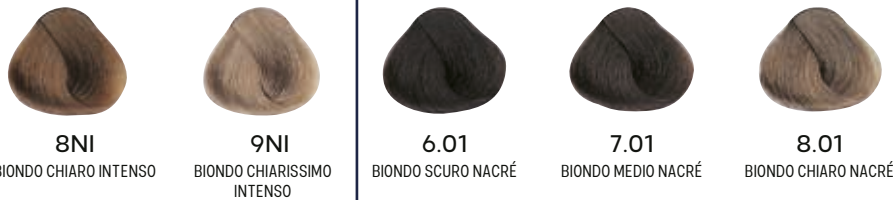
8NI BIONDO CHIARO INTENSO 9NI BIONDO CHIARISSIMO INTENSO 6.01 BIONDO SCURO NACRÉ 7.01 BIONDO MEDIO NACRÉ 8.01 BIONDO CHIARO NACRÉ