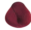
7.62 BIONDO MEDIO ROSSO IRISÉ