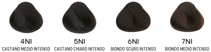
4NI CASTANO MEDIO INTENSO 5NI CASTANO CHIARO INTENSO 6NI BIONDO SCURO INTENSO 7NI BIONDO MEDIO INTENSO