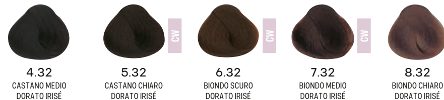
4.32 CASTANO MEDIO DORATO IRISÉ 5.32 CASTANO CHIARO DORATO IRISÉ 6.32 BIONDO SCURO DORATO IRISÉ 7.32 BIONDO MEDIO DORATO IRISÉ 8.32 BIONDO CHIARO DORATO IRISÉ