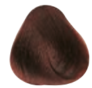
4.65 CASTANO MEDIO ROSSO MOGANO