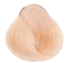
9.423 BIONDO CHIARISSIMO RAMATO IRISÉ DORATO