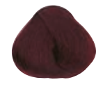
5.65 CASTANO CHIARO ROSSO MOGANO