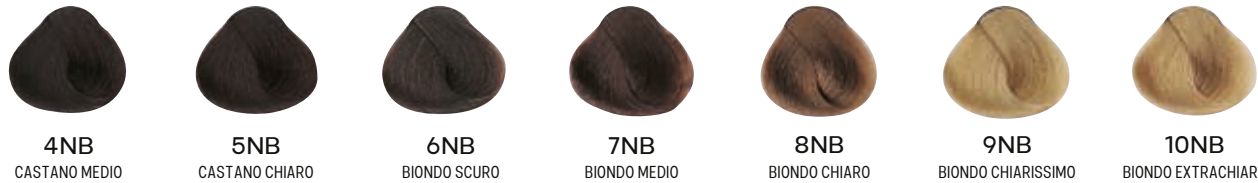
4NB CASTANO MEDIO 5NB CASTANO CHIARO 6NB BIONDO SCURO 7NB BIONDO MEDIO 8NB BIONDO CHIARO 9NB BIONDO CHIARISSIMO 10NB BIONDO EXTRACHIARO