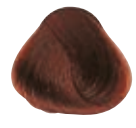
7.45 BIONDO MEDIO RAME MOGANO