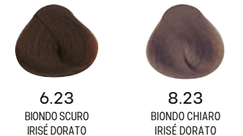
6.23 BIONDO SCURO IRISÉ DORATO 8.23 BIONDO CHIARO IRISÉ DORATO