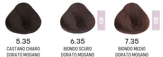
5.35 CASTANO CHIARO DORATO MOGANO 6.35 BIONDO SCURO DORATO MOGANO 7.35 BIONDO MEDIO DORATO MOGANO