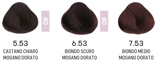
5.53 CASTANO CHIARO MOGANO DORATO 6.53 BIONDO SCURO MOGANO DORATO 7.53 BIONDO MEDIO MOGANO DORATO